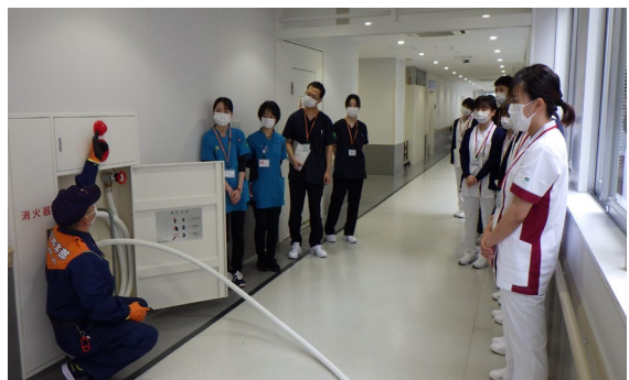
消火栓の操作説明