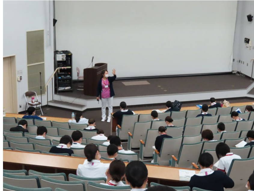
災対マニュアルV3.0の説明