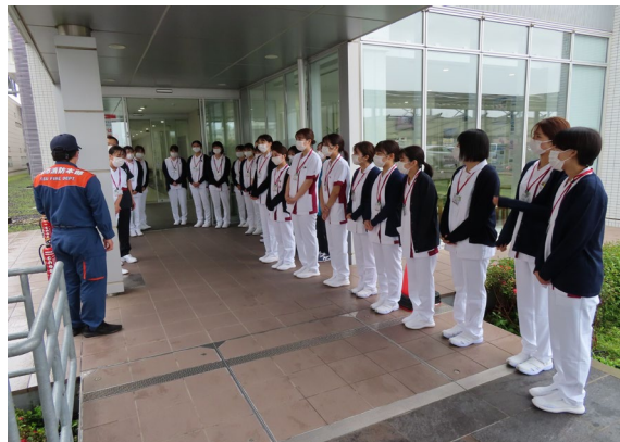
水消火器の操作説明