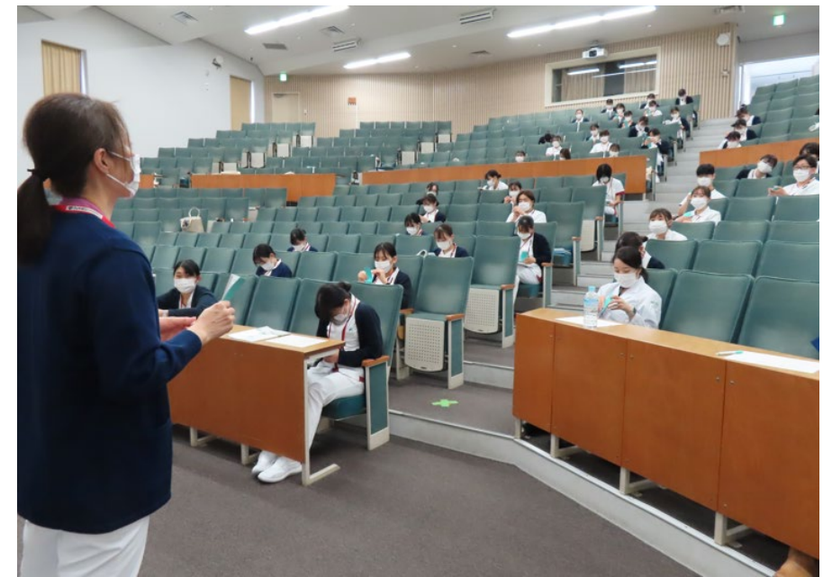
新人職員受講状況