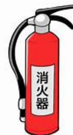
初期消火訓練（水消火器）