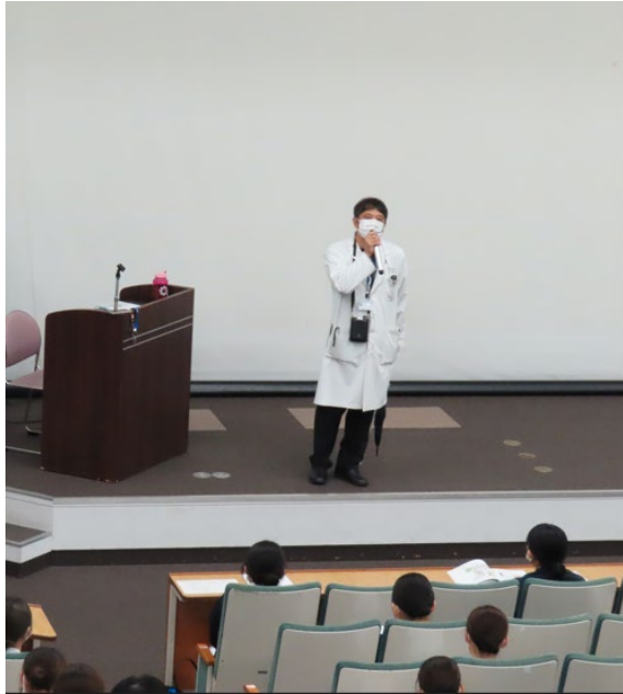
岸和田センター長 冒頭挨拶